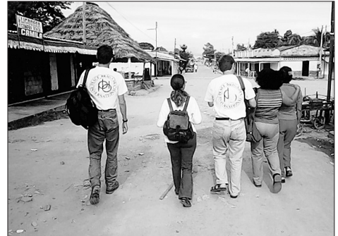
SICHERHEIT PBI-Mitarbeiter begleiten Vertreterinnen der kolumbianischen Frauenrechtsorganisation OFF.

Peace Brigades International ist seit 1981 erfolgreich für den Schutz der Menschen-