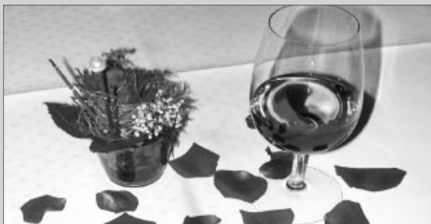
Herzscherz und romantische Atmosphäre im Landgasthof Löwen Heimiswil.